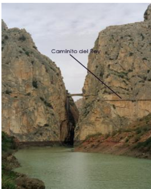
El río Guadalhorce atravesando el Desfiladero de los Gaitanes. Señalado el Caminito del Rey.

El Caminito del Rey es una senda aérea, atípica “ferrata”, construida en las paredes del Desfiladero de los Gaitanes en El Chorro, (Álora-Málaga). Es un camino adosado al citado desfiladero con una longitud de 3 kilómetros, que cuenta con largos tramos y con una anchura de apenas 1 metro.