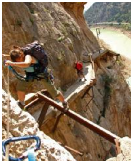
Zona deteriorada del Caminito del Rey. Sólo se ven las vigas de hierro.

Las especies botánicas más características de estas áreas son: el pino carrasco, el piñonero, la encina, el eucalipto, el majuelo, la aulaga, la estepa blanca, la jara y la sabina negral, el tomillo, el romero, la retama... En cuanto a la fauna, en las zonas altas habitan los gatos monteses y las cabras montesas. Animales de menor tamaño como el mirlo y el vencejo, la chova y la paloma, el martín pescador y el búho, entre otros, viven en la zona baja, junto al agua. En las partes medias de la garganta el halcón, cernícalo vulgar y el azor, así como otras rapaces de tamaño medio. La cumbre es lugar y feudo de nidificación de las grandes rapaces como el águila real o el buitre leonado. Otros habitantes del Paraje son la jineta, el lirón, el conejo, la liebre, el meloncillo... Si hablamos de los peces que habitan los embalses, podemos hablar de una abundante población de barbos y carpas, y una muy pobre población de lucios.